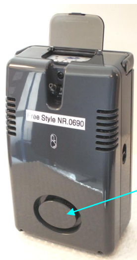
Dæksel til filter

Dækslet til filteret tages forsigtigt af og filteret renses ved at ryste eller støvsuge dette. Dette gøres en gang dagligt.